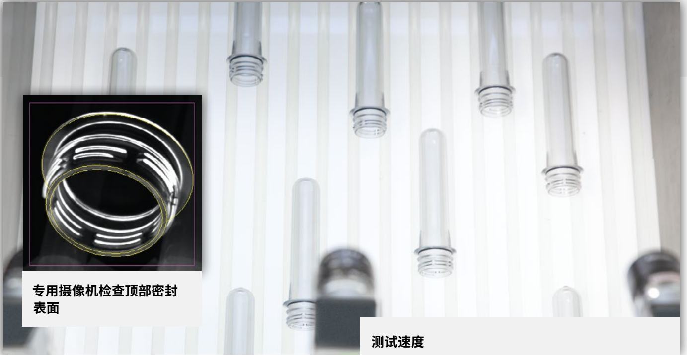
专用摄像机检查顶部密封表面

使用 PreMon® PLUS 选项, 您可以获得主动的坏零件弹出, 并可以提高单个容器的整体质量, 超出对预成型注塑生产线的生产监控。